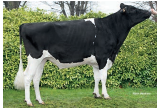
Uber P2M (Golf x Guardian x Musteer)