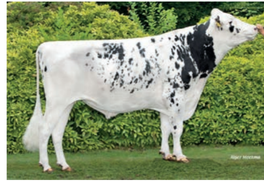
Superman (Palmer x Axminster x Board)