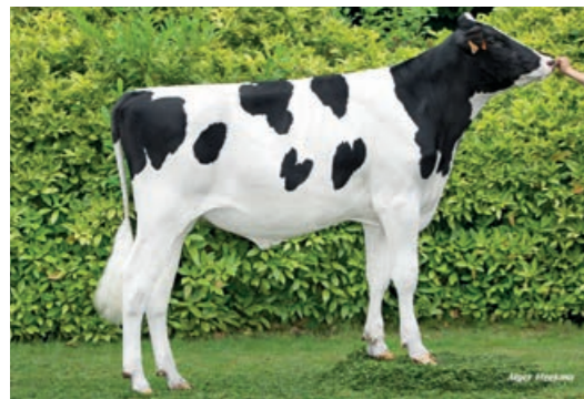
PM Vink PP (Surfer P x Porky P x Altadateline)