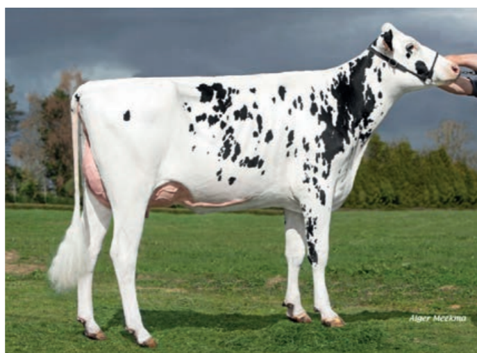
Superman dochter 5463