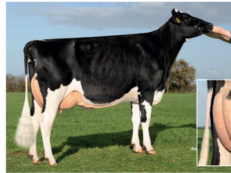
Rewood Man (Yearwood x Lighthouse)