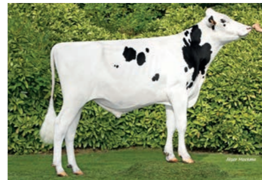
Vistigo P (Talun P x San Remo x Gigabyte)