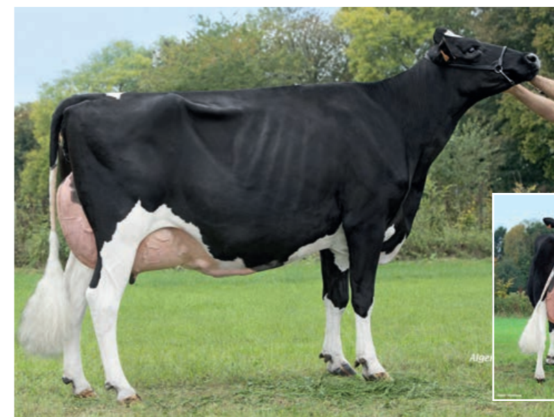
DKR Badboy (Perfect x Adaway x King Doc)

Rewood Man dochter Tonnie 137 AB86 Eig: Mts. De Koe, Molkwerum