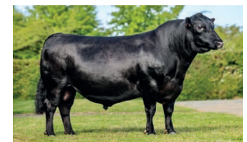
Black Angus stier BR West GD

Prijzen zijn per dosis, excl BTW en onder voorbehoud, bij levering in eigen vat. Bij levering via een K.I. organisatie worden de distributiekosten doorberekend. Op al onze overeenkomsten zijn de door ons bij de Kamer van Koophandel te Zwolle gedeponeerde algemene voorwaarden van toepassing. In geval van een breukrictje krijgt men gratis een ander rictje, mits het breukrictje aan de vertegenwoordiger wordt gegeven. Als men het breukrictje heeft weggegooid, kan men geen aanspraak maken op een nieuwe dosis.