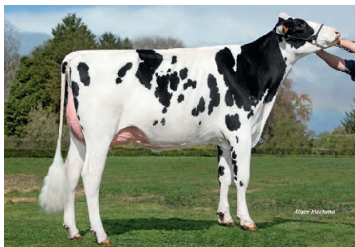
Superman dochter 5459